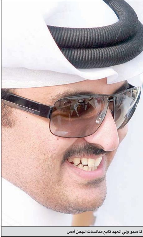
□ سمو ولي العهد تابع منافسات الهجن أمس